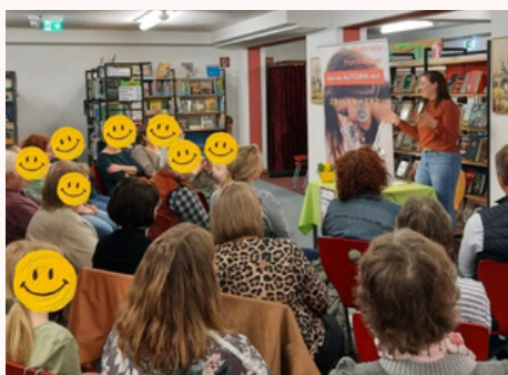
Lesung Bücherei Tittling

Aus ihrem Hobby wurde also schnell mehr. Auf die erste Vorlesung folgten schnell weitere und aus dem Hobby wurde eine Vollzeitbeschäftigung.