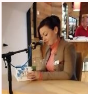
Lesung Mundarttage Deggendorf

Werk "Ebs zum Locha fia enk Grantla" in den Händen. Nach und nach folgten weitere Mundartbände und dann auch schon die ersten Romane.